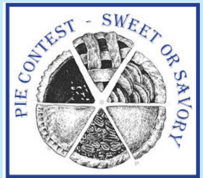
Concurso de pastel - Dulce o salado